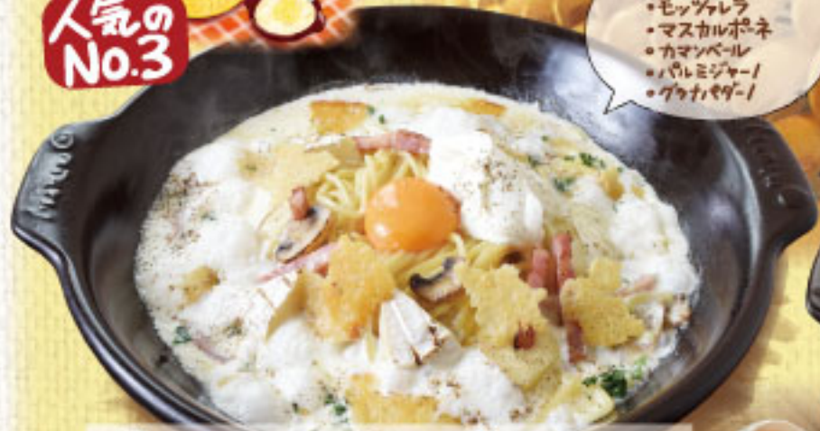
濃厚と種チーズとベーコンの贅沢パルメナラ ¥2,390 (税別2,629)