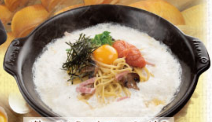
博多明太子とベーコンのパルメナラ ¥2,290 (税別2,519)