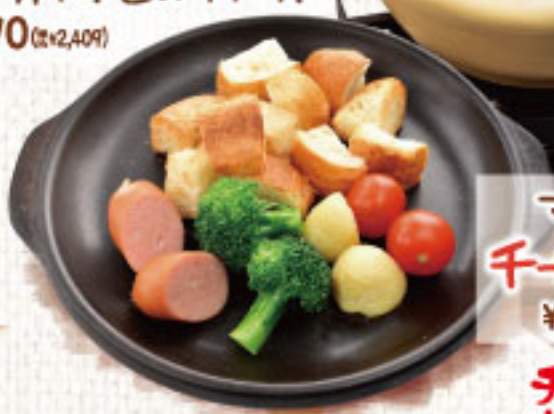
マリノ自慢の チーズフォンデュ ¥2,090 (税別2,299)