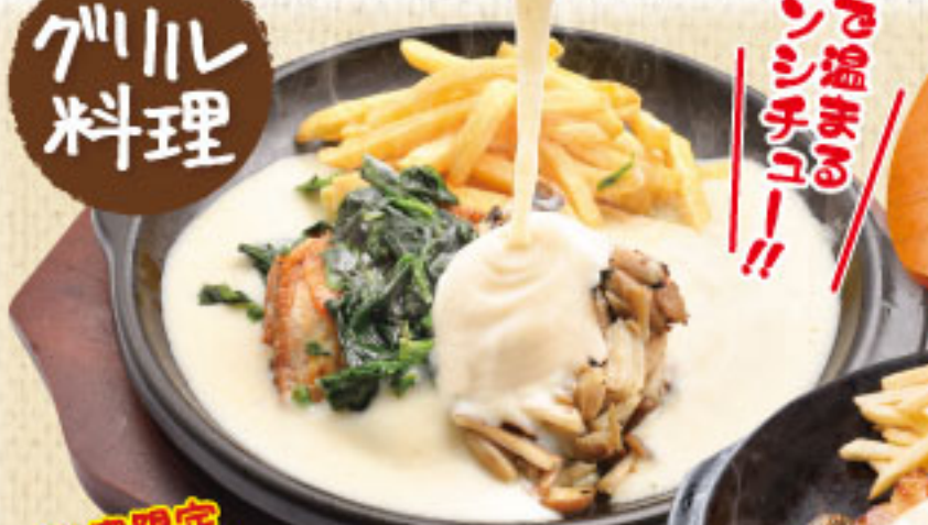
期間限定 きのことほうれん草の チキングリルシチュー ¥2,090 (税別2,299)