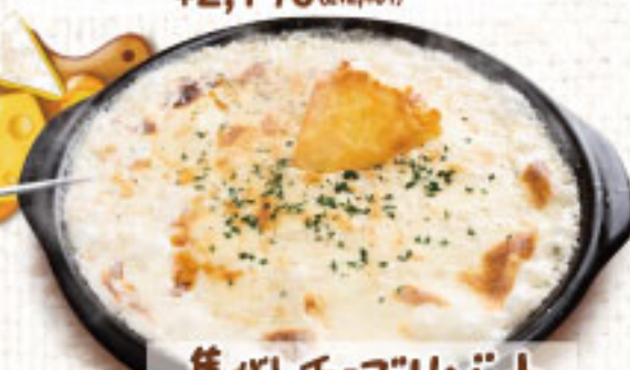
焦がしチーズリゾット ¥1,890 (税別2,079)