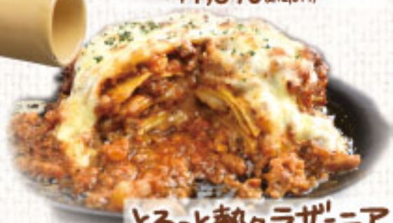
とろっとならざーニア ¥2,090 (税別2,299)