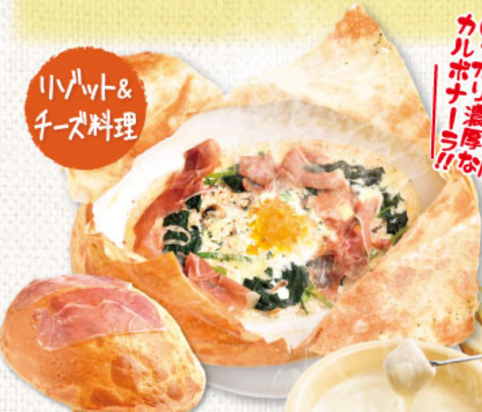
生ハムとほうれん草の カルボナーラパイ包みリゾット ¥2,190 (税別2,409)