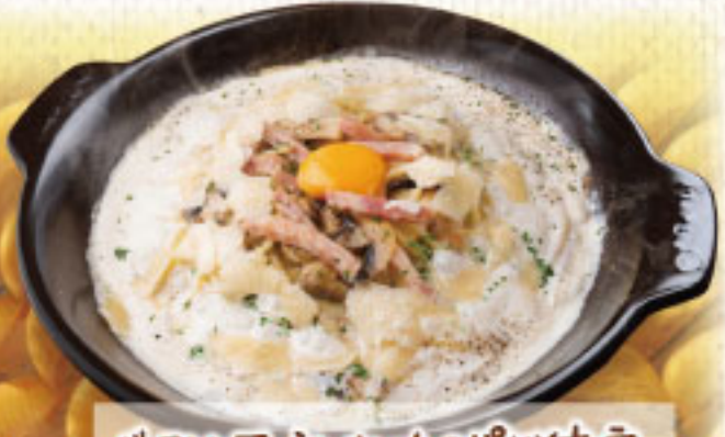
ベーコンとマジニェルムのパルメナラ ¥2,190 (税別2,409)