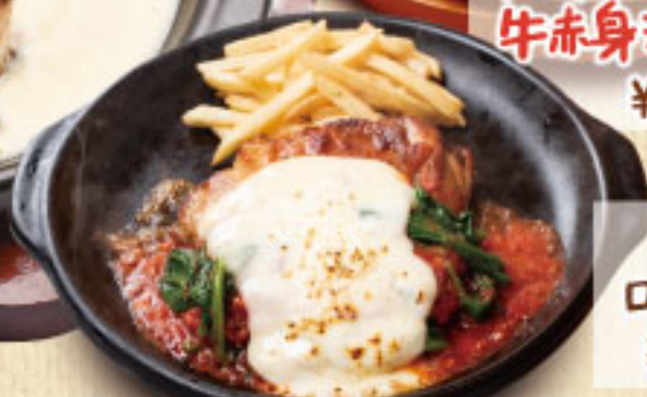
まっ赤とトマトの ローマチキンステーキ ¥1,990 (税別2,189)