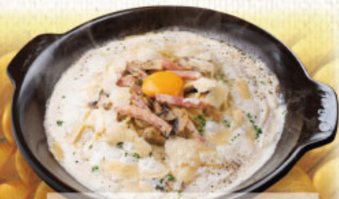
ベーコンとマジニェルムのパルメナラ ¥2,190 (税別2,409)