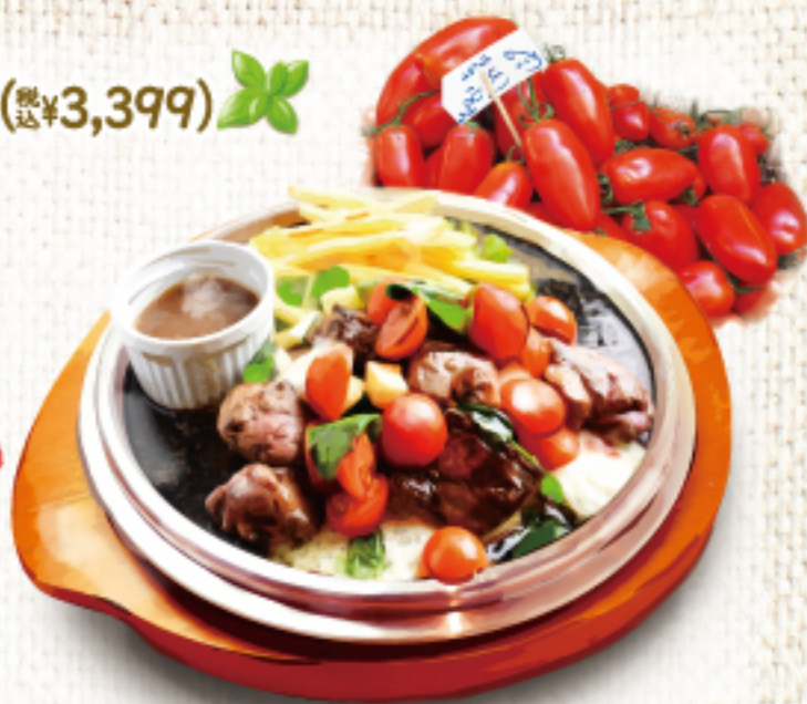
ぷろぷろトマトとモッツァレラチーズのヒレステーキ(200g)