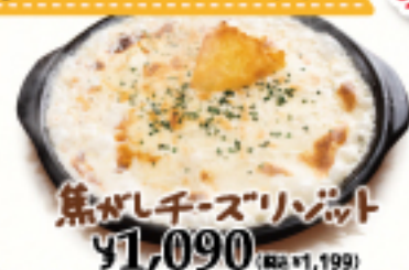
焦がしチーズリゾット ¥1,090 (税込 ¥1,199)