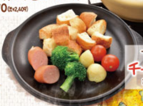
マリノ自慢の チーズフォンデュ ¥2,090 (税別2,299)