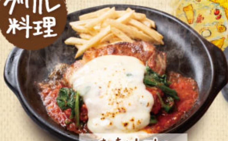
ま・赤とマトの ロマーナチキンステーキ ¥1,990 (税別2,189)