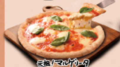
元祖! マルゲリータ