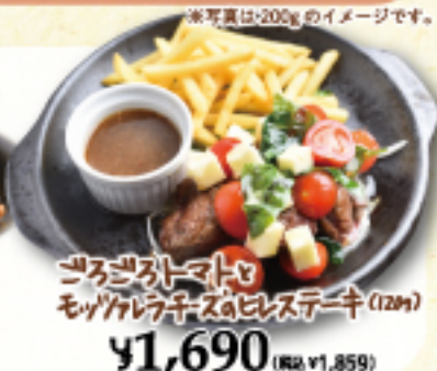
ごろごろトマトと モッツァレラチーズのピステキ (12分) ¥1,690 (税込 ¥1,859)