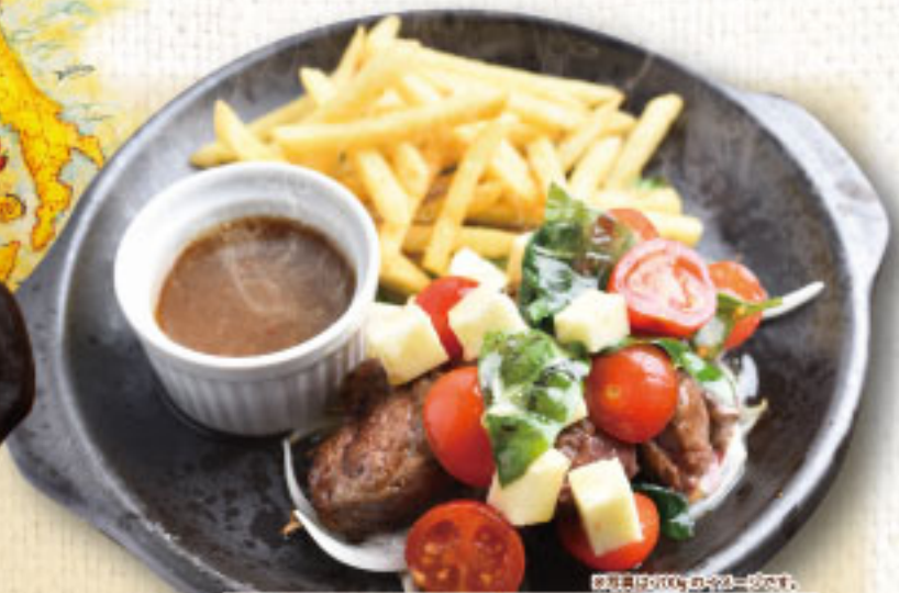
ジューシートマトと モッツアレラチーズのヒレステーキ (120g) ¥2,390 (税別2,629)