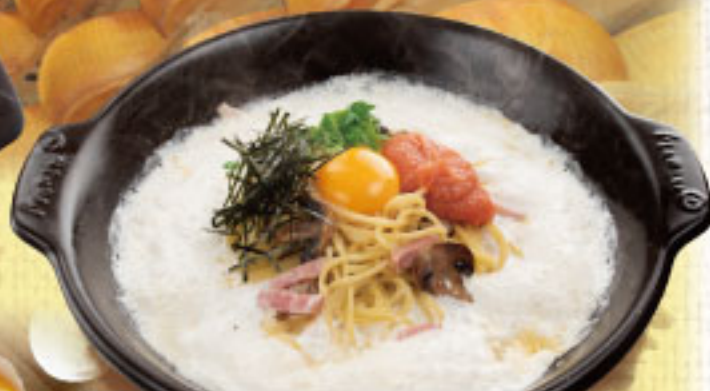
博多明太子とベーコンのパルメナラ ¥2,290 (税別2,519)