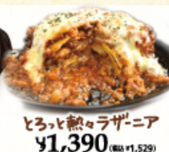
とろっと熱々ラザニア ¥1,390 (税込 ¥1,529)