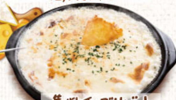
焦がしチーズリゾット ¥1,890 (税別2,079)