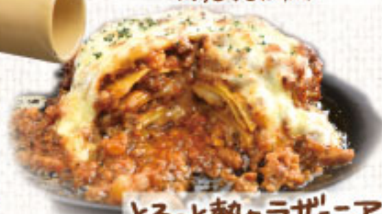
とろっとならザニア ¥2,090 (税別2,299)