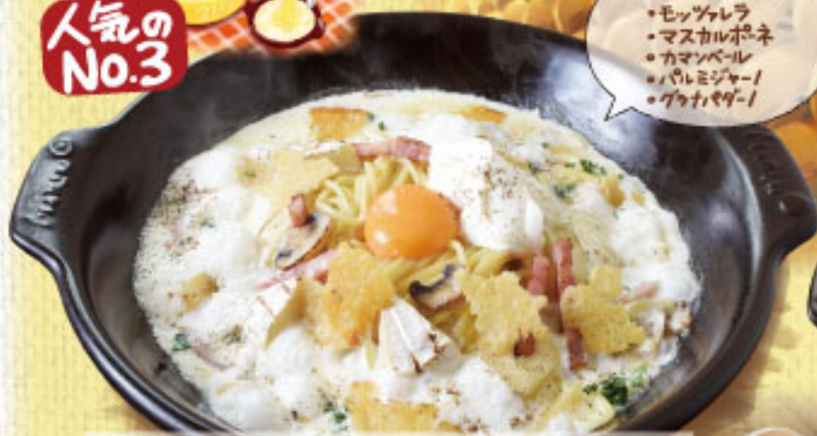
濃厚と種チーズとベーコンの贅沢パルメナラ ¥2,390 (税別2,629)