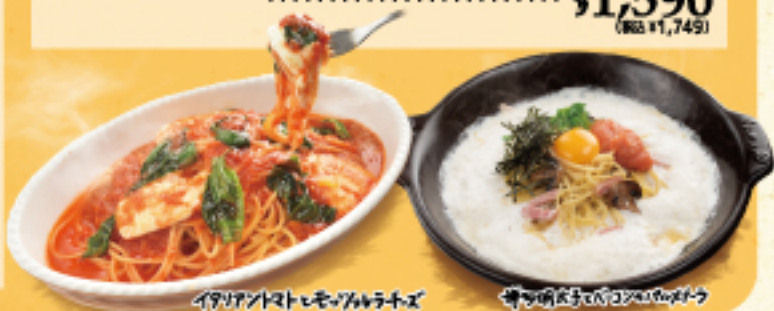
イタリアントマトとモッツァレラチーズ