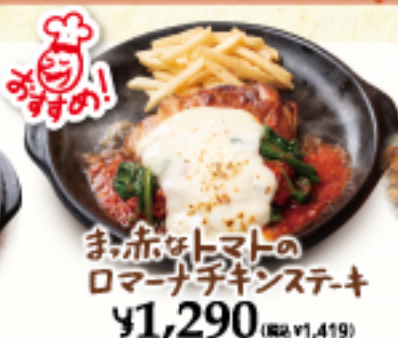
ま・赤・トマトの ローマチキンステーキ ¥1,290 (税込 ¥1,419)